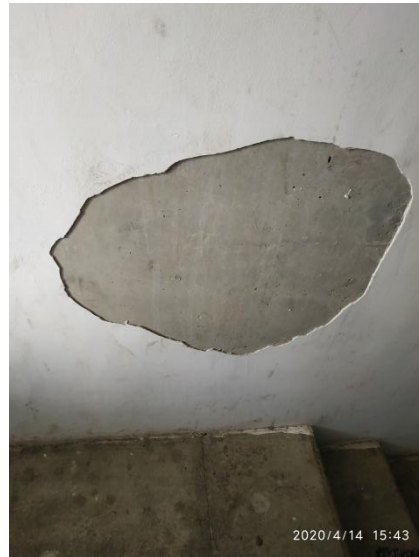
Трещины на стенах и потолке