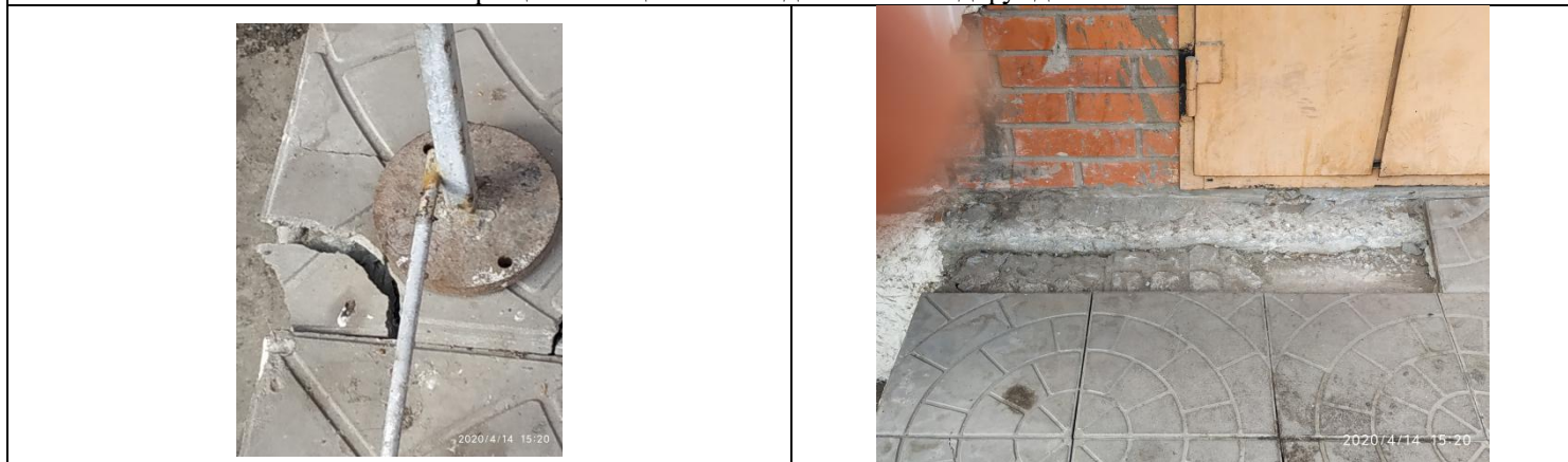
Крыльцо второго подъезда со стороны Кирова