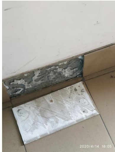
Отсутствие половой плитки/плинтуса