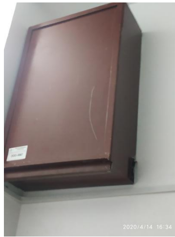
Несанкционированное размещение оборудования провайдером