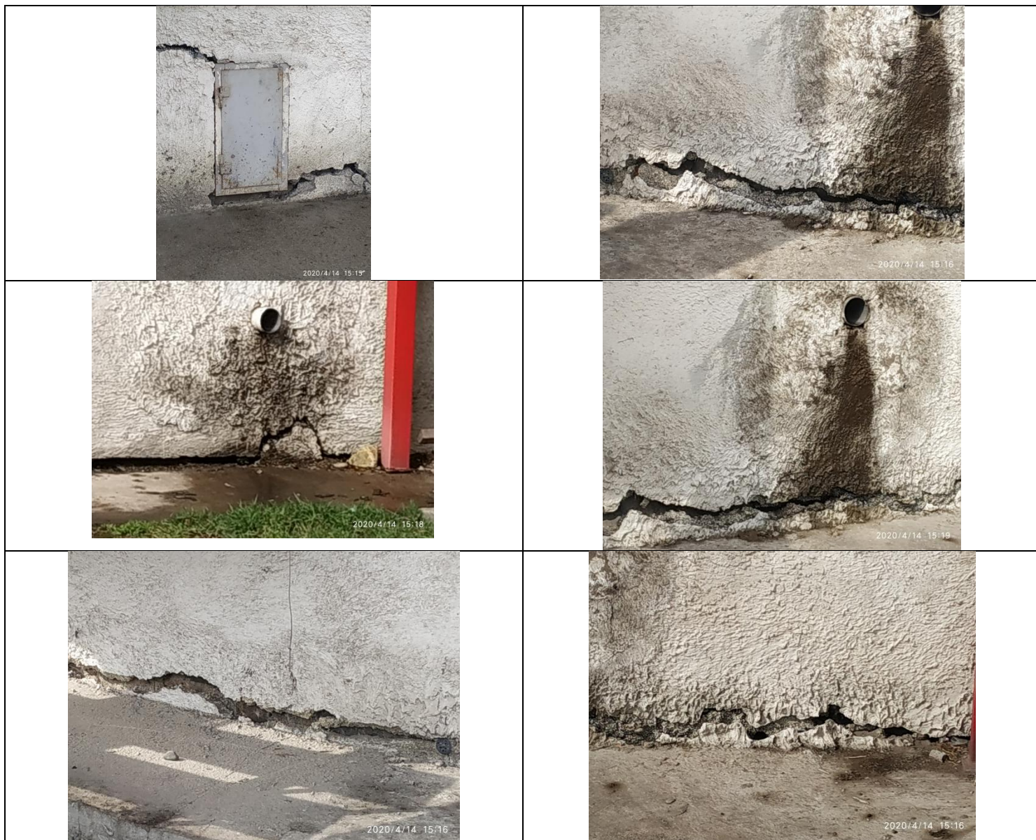
Трещины по цоколю. Вода стекает под фундамент