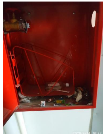
Отсутствуют пожарные рукава