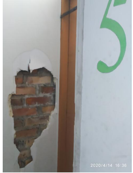
Стены и откосы пожарной лестницы